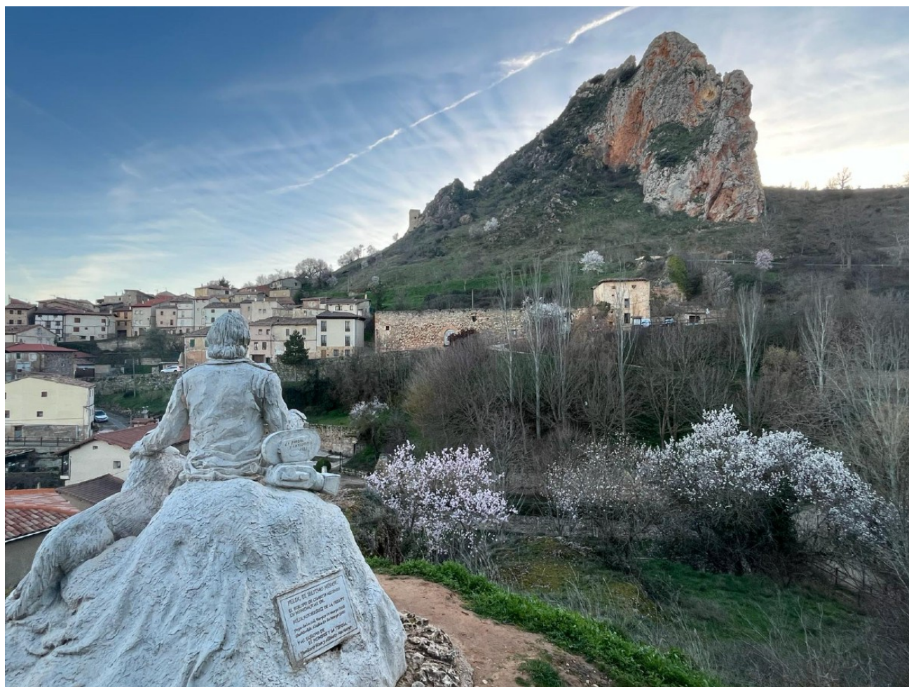
El poble de Poza de la Sal i l'estatua commemorativa de Félix Rodríguez de la Fuente

Poza de la Sal és també coneguda per ser la localitat natal del naturalista i divulgador Félix Rodríguez de la Fuente.