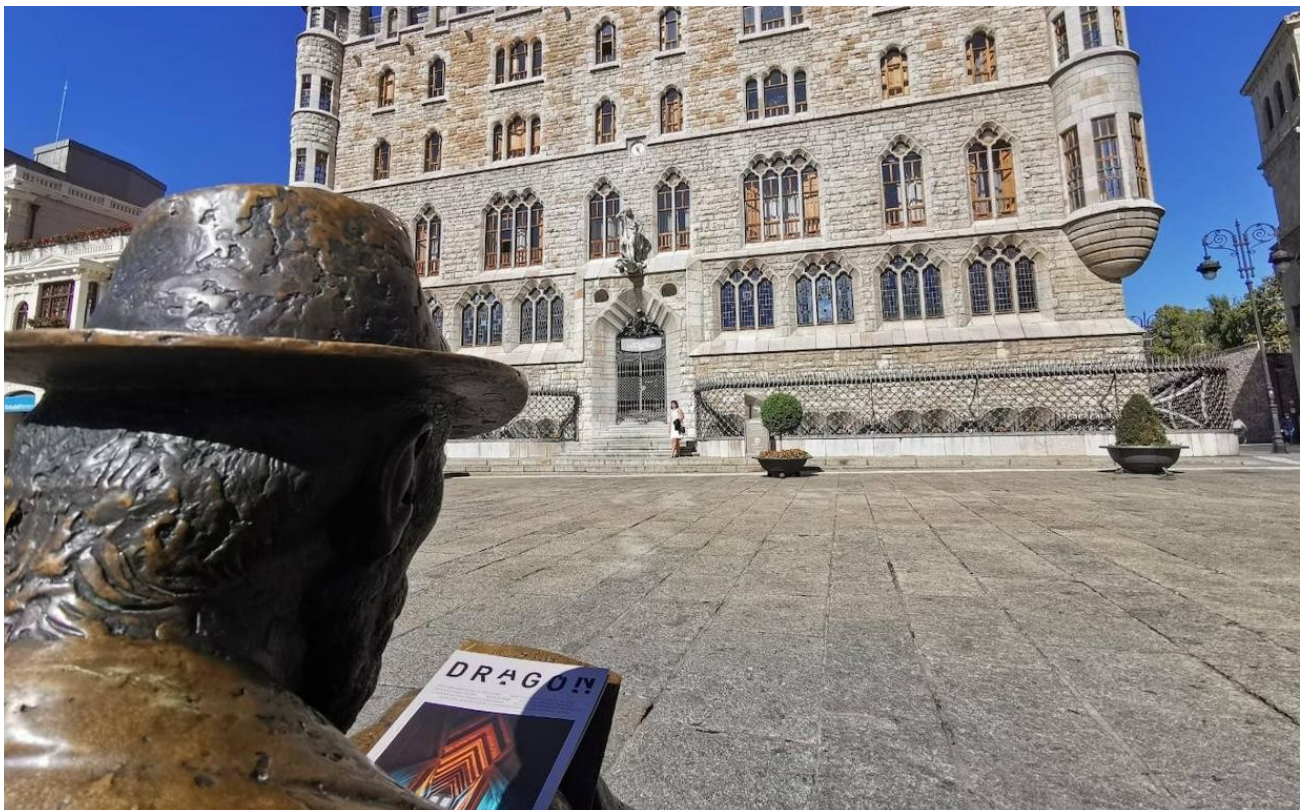
Una escultura a on Gaudí descansa a un banc davant de la Casa Botines

El resultat va ser la primera casa de veïns de Gaudí, un edifici en el qual va combinar funcionalitat, simbolisme i una primerenca visió racionalista , que li va servir com a laboratori d'idees per a les seves obres posteriors com la Casa Calvet, la Casa Batlló o la Casa Milà .