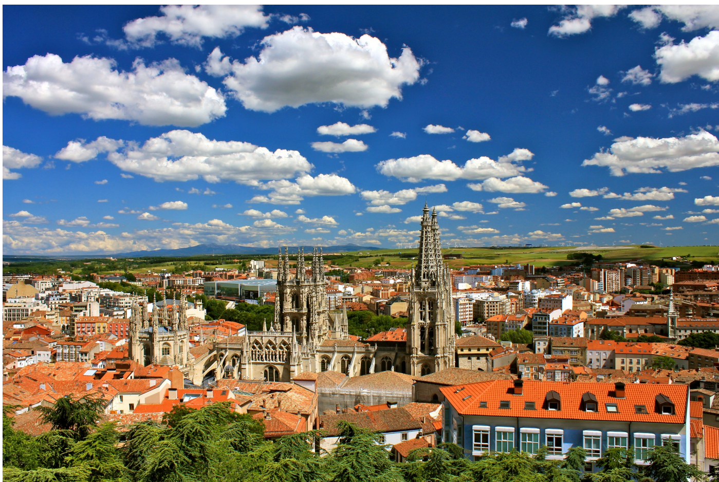
Una preciosa panoràmica de la ciutat de Burgos amb el perfil de la espectacular catedral

Si! Teniem moltes ganes d'aquest viatge a Castella, conjunts monumentals, història, gastronomia... Descobriem una ciutat històrica i altres meravelles de la província. Ah! I coincidint amb l'any Gaudí, no podia faltar una visita a una obra seva molt especial, però hi ha molt més! Voleu saber que us tenim preparat? Doncs, vinga, al "lio"!