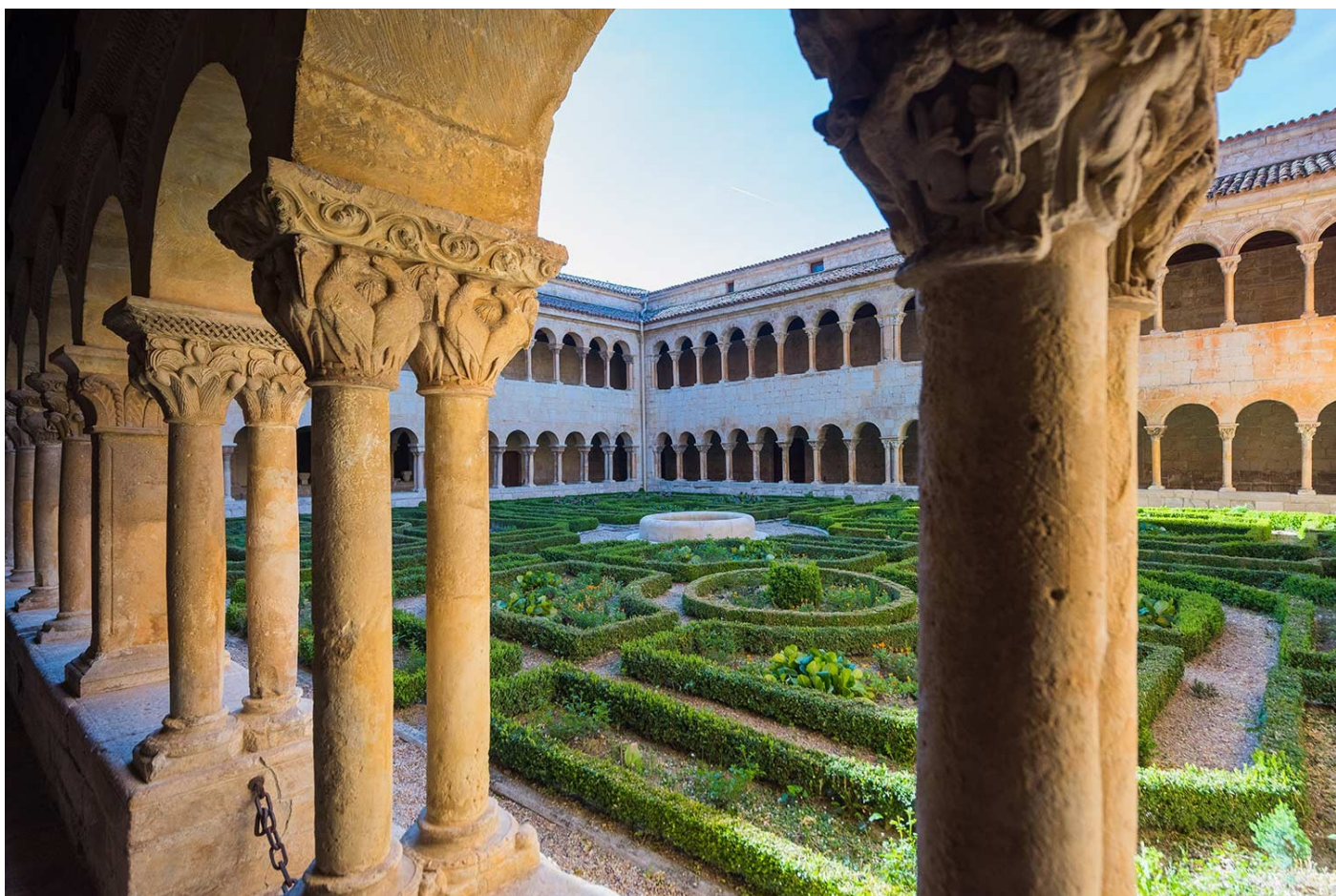
Jardi del Monestir de Silos

Completa la visita del claustre, el jardí , on es pot veure el seu famós xiprer plantat en 1882, de més de 25mt.